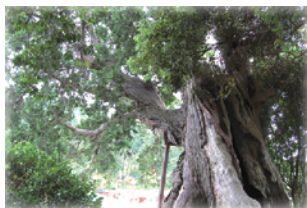
〔豊橋市石巻本町字東木 / 根4♀〕