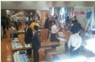
暑さを感じるほどの 熱気溢れる会場

10月25日(木)「こだわり商品フェア」を開催しました。前回より広い会場でしたが、数多くのご参加を頂き時間帯によっては超満員。充実した時間を過ごしていただくことができました。ご来場頂いたみなさま、誠にありがとうございました。今後も激変が予想される業界。来年はまた、新しいアイテムをご紹介できるよう頑張ります。今後共よろしく願います。