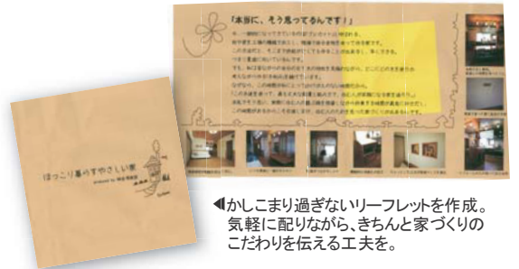
◀かしこまり過ぎないリーフレットを作成。気軽に配りながら、きちんと家づくりのこだわりを伝える工夫を。