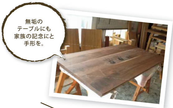
無垢のテーブルにも家族の記念にと手形を。

おくどさんや、お風呂を薪で焚くということをしていない20代、30代に人気の薪ストーブを囲む暮らし。ゆったりと燃える炎を眺めながら家族とゆったりと過ごす。会話を楽しむ。そんな暮らしが人気です。また、暖房としてはもちろんですが、調理器具として利用したいという方も増えています。お子さんとピザや、焼き芋を作りながら家の中でたくさんのイベントを楽しめるというのが何よりも魅力のようです。しかし、家の中で火を使うというのはリスクも伴います。提案したいけれど、ちょっと不安という工務店さま、ハウズ北館内の「ファイヤーライフ岡崎」では、保証付きの安心な薪ストーブをご提案から施工、アフターまで当社にお任せいただけますので、ご興味のある方は担当営業までお気軽に御相談ください。