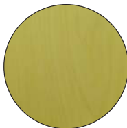
◀白っぽい木目も穏やかなのが特徴。

特徴的な香りを持つカヤ。碁盤や将棋盤用の材としてよく知られているのはもちろん、加工のしやすさから彫刻材としても用いられています。虫除け効果もあり、水や湿気にも強いので、古くは風呂桶や浴室用具材としても使われていました。また、カヤの語源は間伐材や枝をいぶして蚊を追い払ったことから来ているそうです。実も漢方として用いられており、人々の生活の中でそのすべてが余すことなく利用されてきた木です。ぜひ、住宅の中でもご提案ください。