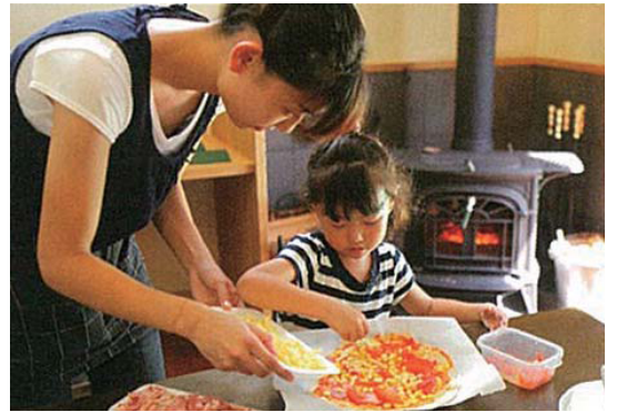
▲ホームパーティーや週末の楽しみにもってこの薪ストーブクッキング。

震災以来、「絆」という言葉が様々なところで聞かれるようになりました。2012年は住宅の中でも、「絆」や「つながり」を感じられる家づくりが注目されました。土地選びでも、実家と近いということが重要視されるようになってきていますし、薪ストーブを家族で囲むライフスタイルや、塗り壁に家族の手形を残したりと、家族同士の「絆」を感じる事が強く求められた1年でした。来年もこの傾向は続くと思われます。今回は、そんなわけで「つながり」を求めるご家族にお勧めの商材をご紹介します。