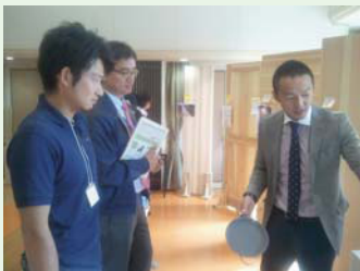
◀真剣な商談が 各ブースで 行われていました。