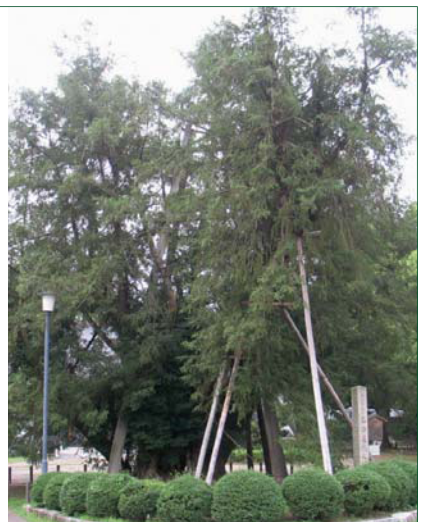
名古屋城にある樹齢600年のカヤの木。▶