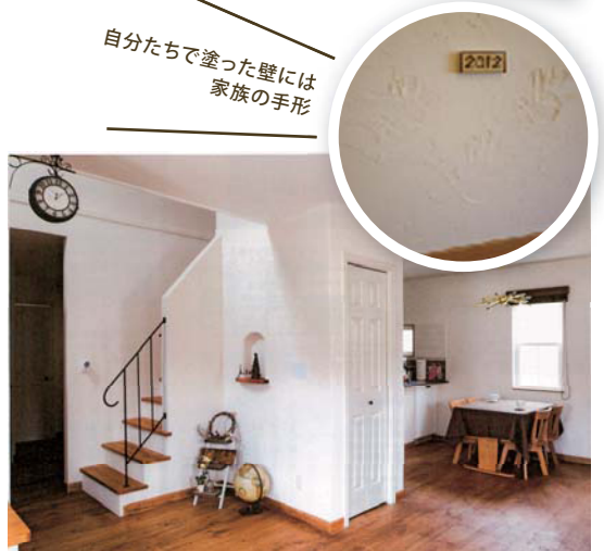
▲無垢の建具や床ともよく合うカルクウォール。

少し前から人気の参加型の家づくり。塗り壁の一部を自分で施工したり、オイル仕上を自分たちで塗ったり。コスト的なメリットもさることながら「家族で作り上げる」ということに価値を見出すお施主様も増えています。弊社で取扱いの「カルクウォール」や「NATURE WALL」も、自然素材の安全性と共に、その施工のしやすさから今年大変人気が出た商材です。柔らかな仕上がりが女性にも人気です。これからますます増えてくる女性主導の家づくりのご提案にもぜひお使いください。