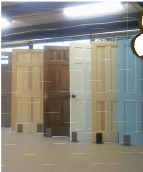
▲本社2階の展示風景。塗装したものの展示もあります。

岡崎製材の建具カタログ「パインコレクション」が新しくなりました。新アイテムも加わっています! また、本社2階の会議室にて展示もはじめました。無垢の建具の良さはやはり実物を見ていただくのが一番! 「お施主様に見せたい!」という方ももちろん大歓迎! お気軽に担当営業まで御連絡ください。