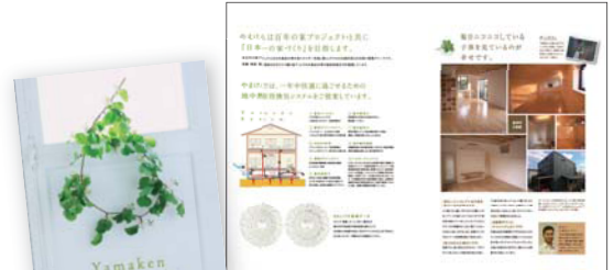
▲お客様のインタビューを掲載。2種類作成し、シーンによって使い分けをしています。

見学会や、新規の問い合わせを頂いても渡すものがない。会社案内が古い。というお悩みの方! 思い切って会社案内を作るのもお勧めです。作る過程の中で、「自社の強み」を考えたり、施工例を整理したり、これまでやってきたことを見つめ直すいい機会にもなります。何から始めよう? という方は、お気軽に御相談下さい。